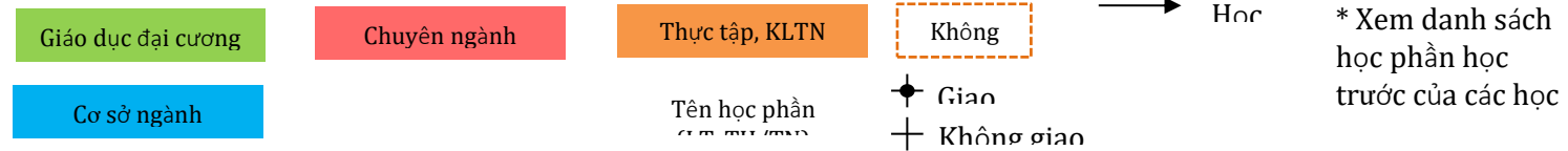
Hình 1. Lộ trình giảng dạy và phát triển kiến thức trong chương trình dạy học